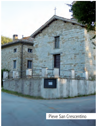
Pieve San Crescentino

INFO: Per mangiare e dormire puoi rivolgerti a Camping Le Ginestre del Catria - Chiaserna (PU) cell. 346.0499219 Villa antica: Loc. Fossato di Cantiano cell. 331.3645556 Ostello San Giovanni Battista - Cantiano: cell. 335.1230615