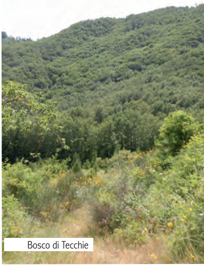
Bosco di Tecchie