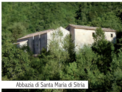
Abbazia di Santa Maria di Sitria