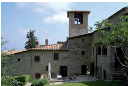
Abbazia di San Faustino (Resort)