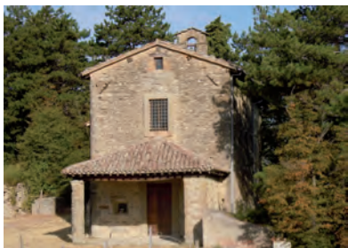
Chiesa Madonna dei Confini