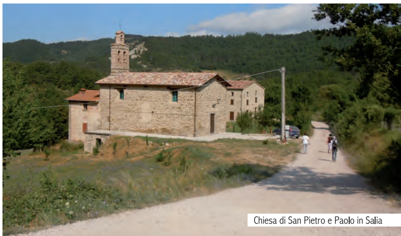
Chiesa di San Pietro e Paolo in Salia